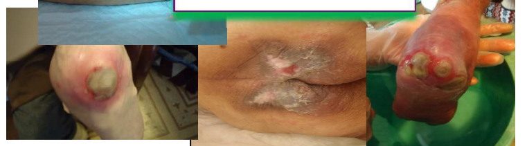
褥瘡や傷等の処置